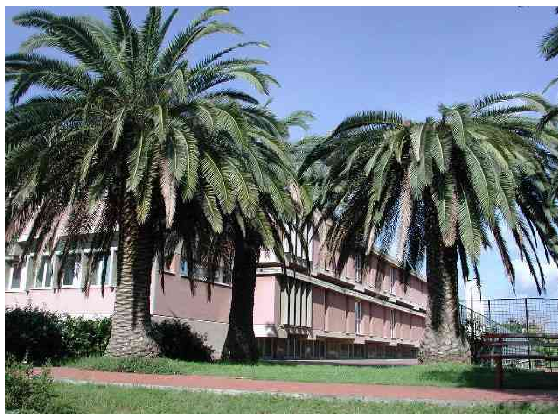
Fig.2 – Phoenix con cima compromessa (dx).Pianta sana (sx).