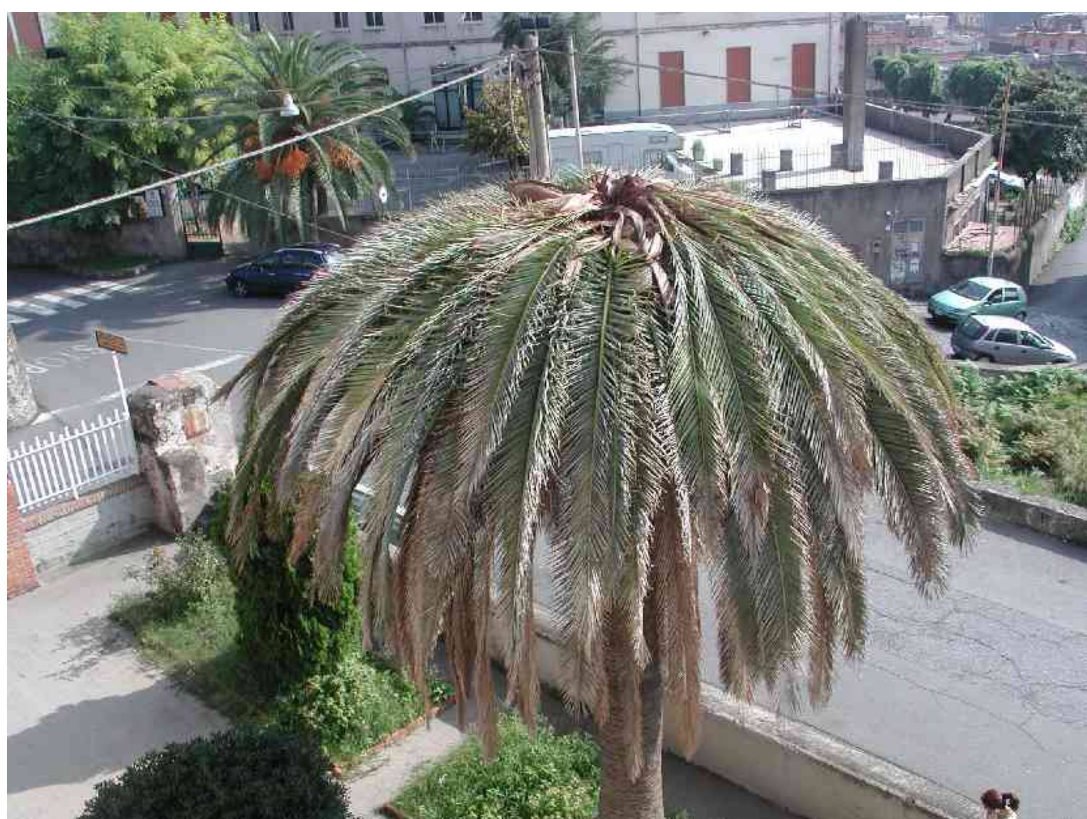
Fig. 3 – Phoenix irrimediabilmente compromessa