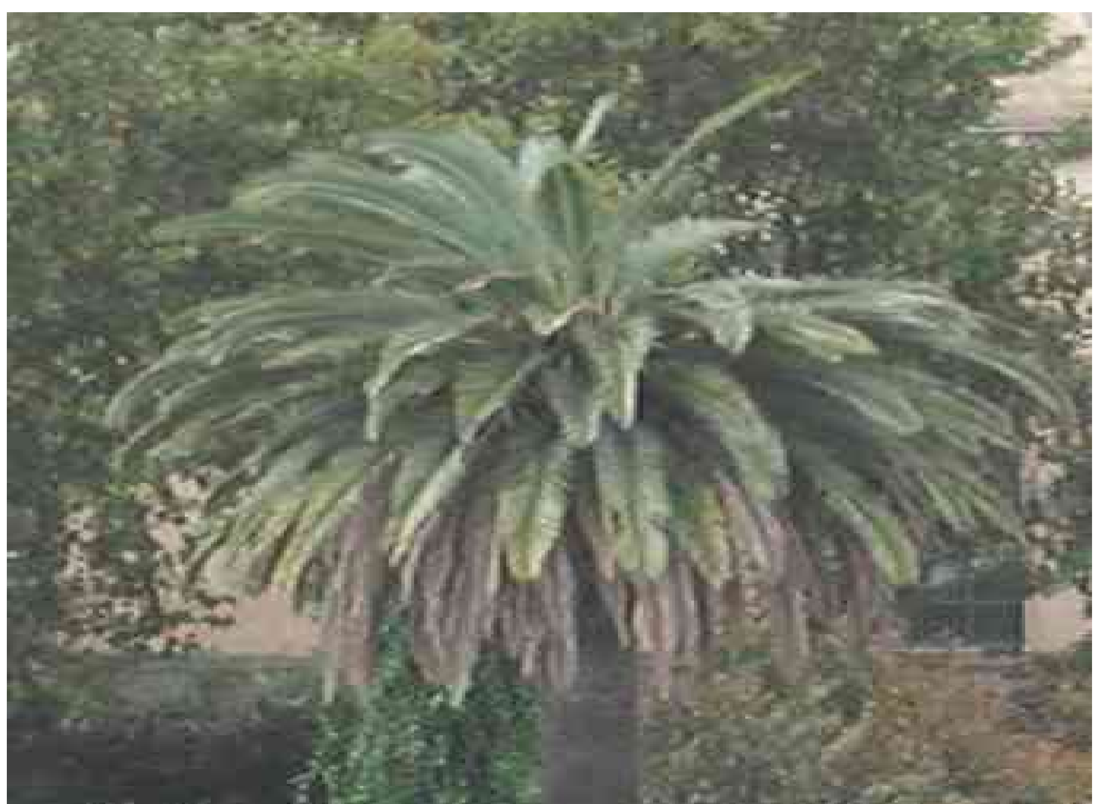
Fig. 1 – Sintomi iniziali: asimmetria della cima

Successivamente l'intera cima si piega, afflosciandosi su se stessa e la pianta sembra a distanza come capitozzata (Fig.2). Da vicino la cima appare fortemente danneggiata e in avanzato stato di marcescenza. In seguito all'avanzare dell'attività di nutrizione delle larve, l'intera chioma apparirà con tutte le foglie ripiegate verso il basso. Le palme in questo stadio d'infestazione sono già irrimediabilmente compromesse. (Fig.3). A terra si possono rinvenire foglie con la base interessata da gallerie e rosure, provocate dalle larve del punteruolo nonché bozzoli, della lunghezza di 4-5 cm e dall'aspetto di piccole noci di cocco, e infine adulti (Fig.4).